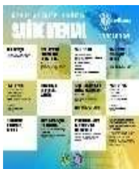
Conferência Saúde Mental Lions Clube de Portugal – d115 cs. 9 de outubro das 9h30 às 16h30

Destaca-se a conferência sobre Saúde Mental e a conferência sobre o Anteprojecto Trabalho XXI e o Congresso do Direito da Família e das Crianças.